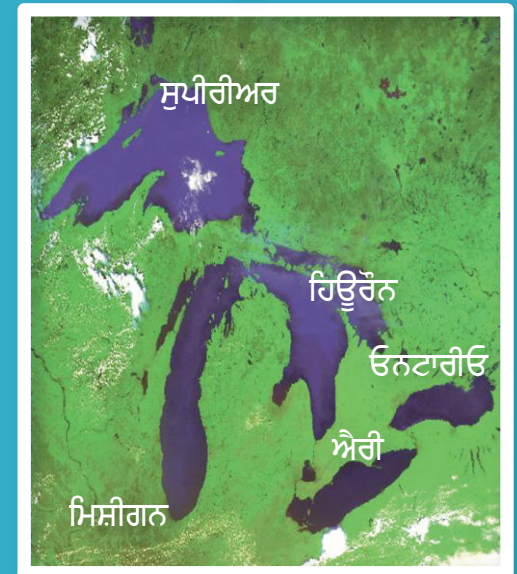
NOAA, ਗਰੇਟ ਲੇਕਸ ਵਾਤਾਵਰਣ ਸਰੋਤੀ ਖੋਜ ਪ੍ਰੋਗਰਾਮ

ਅਮਰੀਕਨ ਈਲ ਅਟਲਾਂਟਿਕ ਸਾਮਨ ਈਸਟਰਨ ਸੈਂਡ ਡਾਰਟਰ ਲੇਕ ਸਟਰਜਿਅਨ ਹੈਂਡਸਾਈਡ ਡੇਇਸ